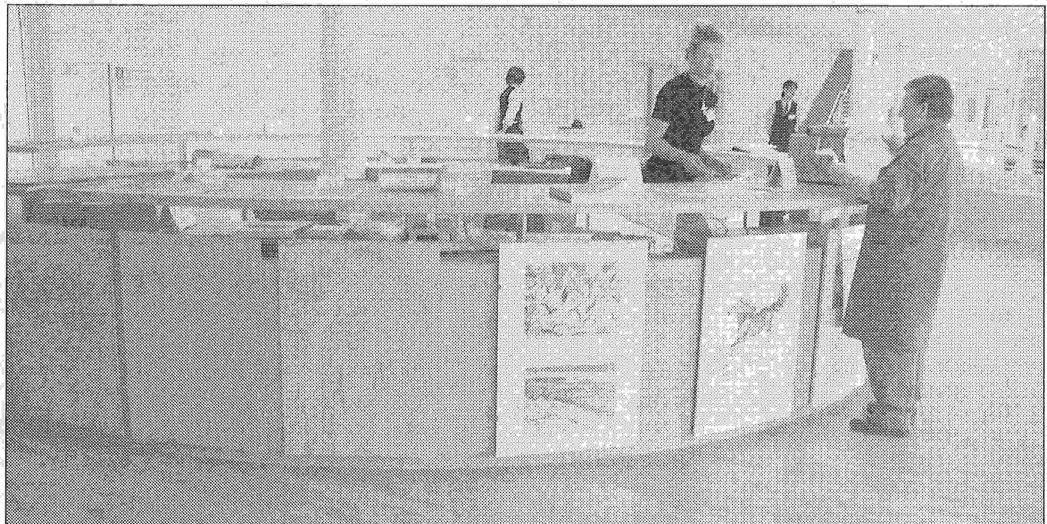
Zu den Arbeiten der Winzerer Firma gehört auch die Eingangstheke im Museum der Phantasie.